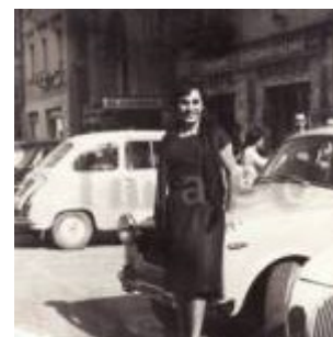
1960 Rimini, ragazza in posa in Piazza Cavour