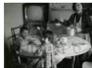
1968 Rimini, famiglia a tavola