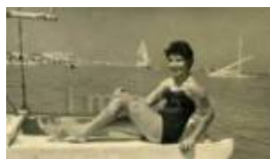
1953 Rimini, ragazza in posa al mare