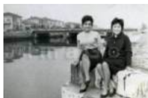
1961 Rimini, amiche in posa sul canale del porto