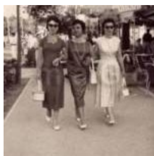
1955 Rimini, amiche a passeggio sul lungomare