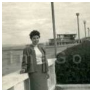
1955 Rimini, in posa sul lungomare