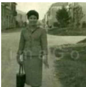
1953 Rimini, ragazza in posa