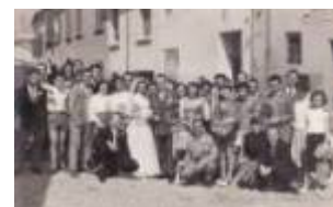
1952 Rimini, gruppo in posa con gli sposi