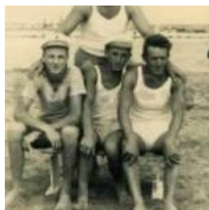
1956 Rimini, bagnini in posa sulla spiaggia