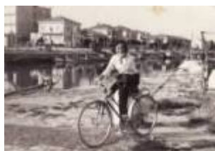
1959 Rimini, ragazza in posa con la bicicletta sul canale del porto