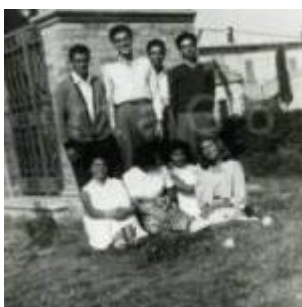
1952 Rimini, amici in posa