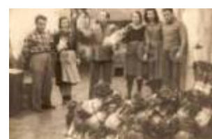
1954 Rimini, in posa con il raccolto