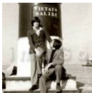
1969 Rimini, amici in posa al porto