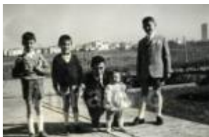
1961 Rimini, famigliari in posa