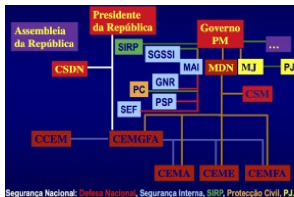
Segurança Nacional: Defesa Nacional, Segurança Interna, SIRP, Protecção Civil, P.J. Struttura del sistema di sicurezza del Portogallo

Diversamente dai Carabinieri, la GNR non ricopre il ruolo di polizia militare, assegnato al Regimento de Lanceiros n. 2 (2° Reggimento Lancieri) o RL2, una unità dell'esercito portoghese responsabile per l'istruzione, l'organizzazione e la manutenzione delle unità operative della Polícia do Exército (Polizia dell'Esercito), senza essere una forza armata indipendente, né una forza di polizia.