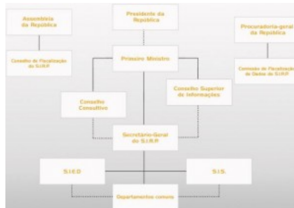
Organizzazione SIRP alla luce della Lei 9/2007

Nel 2007 69 viene definita l'attuale situazione, approvata a larga maggioranza dal Parlamento, con la definizione dell'organico del Segretario generale del SIRP, del Serviço de Informações Estratégicas de Defesa (SIED) e del Serviço de Informações de Segurança (SIS), e con la creazione di quattro strutture comuni a entrambi i servizi nelle aree delle risorse umane, dell'amministrazione e della finanza, dei servizi generali e delle tecnologie dell'informazione e della sicurezza. Le strutture comuni hanno sede presso Forte Dom Carlos I, a Ameixoreira. Questa soluzione ha permesso, da un lato l'ottimizzazione delle risorse umane e finanziarie, in precedenza duplicate, e, dall'altro, la dedizione esclusiva dei servizi di informazione alle loro attribuzioni e competenze.