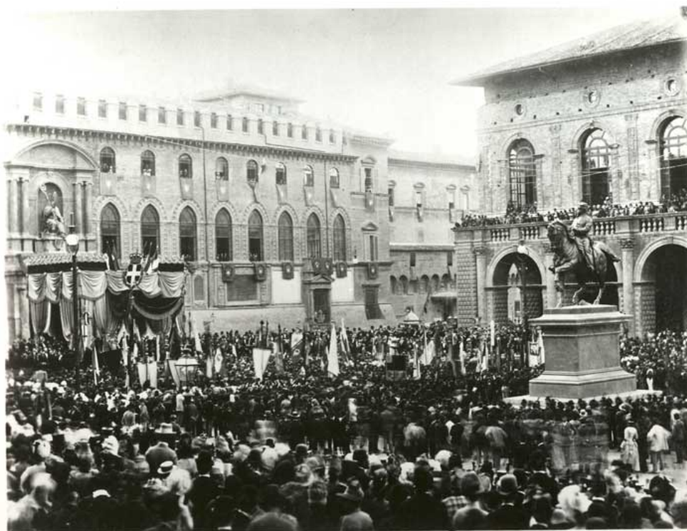
Inaugurazione del monumento di Vittorio Emanuele II, Fondazione Carisbo

Il volume propone, per ogni singolo avvenimento cui è stata dedicata una lapide o un monumento, una breve sinopsi storica, corredata da immagini della lapide e trascrizione della relativa epigrafe, foto del monumento, insieme ad altre immagini e documenti, brevi biografie o stralci di lettere e cronache dell'epoca che permettono al lettore di avere uno sguardo completo sull'avvenimento.