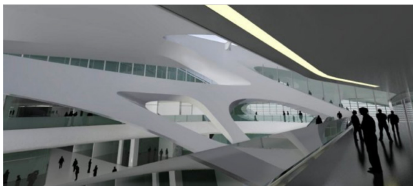
Figg. 5-6: Shopping and Leisure Center Jesolo Magica, Zaha Hadid Architects, 2010-2014 (render, non realizzato).