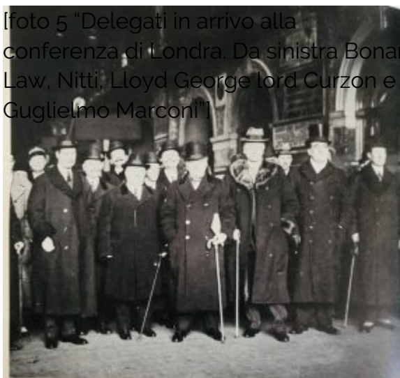
All'arrivo, per la Conferenza di Londra, nel 1920; da sinistra, Bonar Law, Nitti, Lloyd George, lord Curzon; penultimo a destra, Guglielmo Marconi.

[foto 5 "Delegati in arrivo alla conferenza di Londra. Da sinistra Bonar Law, Nitti, Lloyd George lord Curzon e Guglielmo Marconi"]