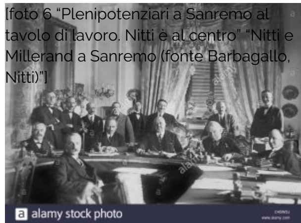
[foto 6 "Plenipotenziari a Sanremo al tavolo di lavoro. Nitti è al centro" "Nitti e Millerand a Sanremo (fonte Barbagallo, Nitti)"]

Decisamente dimenticata dalla storiografia 5 , la riunione italiana raccoglieva i cocci di tutti gli errori e i ritardi che progressivamente si erano accumulati riguardo alla questione ottomana ma anche quello di tutti i problemi rimandati: irrisolti erano rimasti i rapporti con la Germania e l'esecuzione del trattato, la questione delle minoranze magiare e del trattato con l'Ungheria, la politica verso la Russia bolscevica e la questione adriatica avvertita ora come vera e propria minaccia alla pace europea che si aggiungevano alla già complessa trattativa principale.