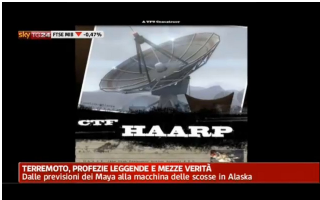
Fig. 3. SkyNews24 smonta miti e teorie complottistiche.

Si veda in particolare la nota 11.