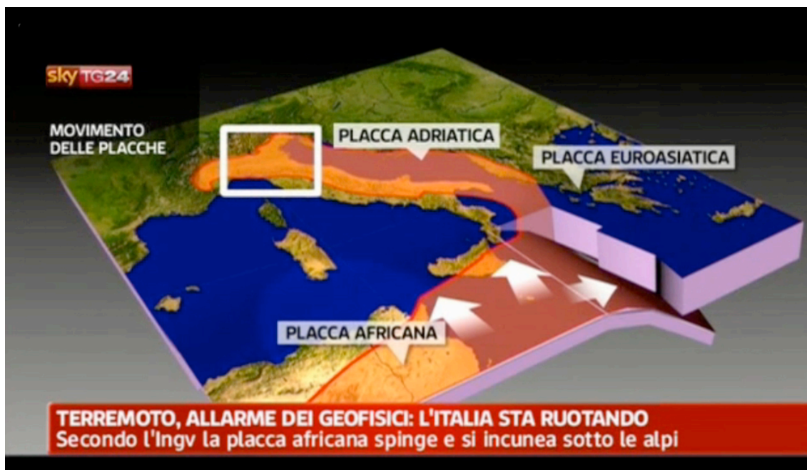
Fig. 2. Effetto di "spettacolarizzazione" della spiegazione scientifica: "l'allarme dei geologi".

Si veda in particolare la nota 2.